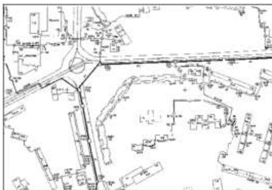
Рисунок 8.4. Пример растрового слоя

Растровый объект задается файлом изображения и физическими координатами на местности, соответствующими изображению, так называемым описателем растрового слоя. Информация о растровых объектах хранится в файлах с расширением ZRS.