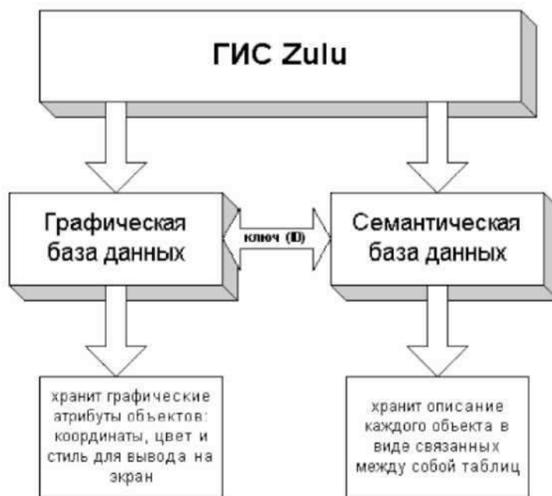
Рисунок 8.1. Структурная схема представления информации в системе Zulu

Графические данные — это набор графических слоев системы. Графический слой представляет собой совокупность пространственных объектов, относящихся к одной теме в пределах некоторой территории и в системе координат, общих для набора слоев.