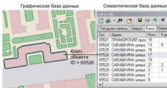
Рисунок 8.2. Пример взаимодействия семантической и графической баз данных

Для описания объектов графической базы данных (например, домов) создается семантическая база данных, в которую заносится информация по каждому дому: адрес, номер дома, тип дома и т.п. Для связи семантической и графической баз данных одно из полей семантической базы данных содержит ключ объекта графической базы, к которому относится одна или несколько строк семантической базы. При этом графическая и семантическая базы данных могут находиться в разных каталогах, на разных дисках и даже на разных компьютерах (сервере и локальном компьютере).