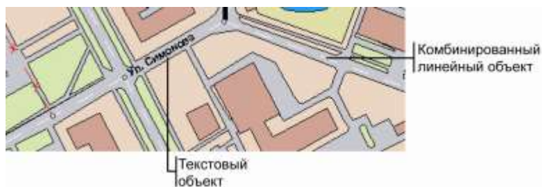
Рисунок 8.5. Примеры объектов